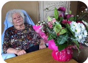
Mme F. - Oradour/Vayres